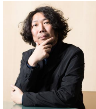
▲マンボウやしろ教授