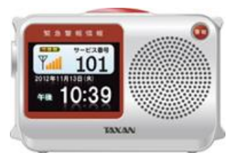
防災ラジオ (MeoSound VL1)

このほか、全国各地の複数の自治体で前向きに検討を頂いており、順次、「V-ALERT」による災害情報伝達や平時情報の配信網が広がることが期待されています。