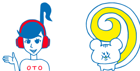
LisCom モデレータ（左:おと、右:りすこ）

LisCom は、TOKYO FM の“モール型”ファンコミュニティとなり、ユーザーは、ショッピングモールの中心にある広場にあたる「LisCom センタールーム」でコミュニケーションやキャンペーンを楽しみながら、ショッピングモールの各店舗にあたる「番組ごとのサークル」にも自由に参加し、回遊することができます。「LisCom センタールーム」で生まれた活気やホットな話題を、各サークルの活性化につなげていきます。各ワイド番組や各番組スポンサーのサークルは、順次オープン予定です。