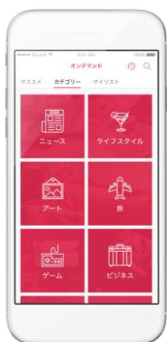
◀カテゴリ別にオンデマンドコンテンツが検索可能