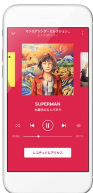
◀オンエア情報からレコチョクへ直接アクセス

全国の FM 局スタッフが厳選した各番組のオンエア楽曲やチャートから、試聴～購入までをシームレスにつなぎます。※ドコモの「スゴ得コンテンツ」版、ソフトバンクの「App Pass」版ではご利用頂けません。