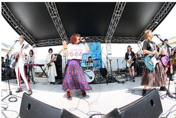
▲ザ・コインロッカーズのライブ