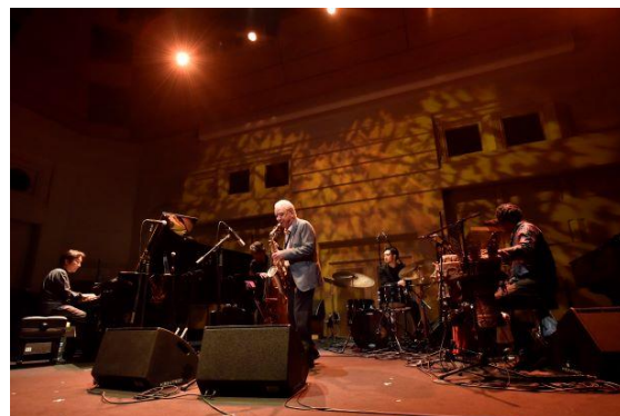
▲渡辺貞夫クインテット