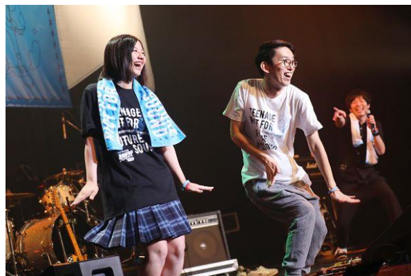
▲渡邊美穂（日向坂 46）の開会宣言と「SCHOOL OF LOCK!」あしざわ教頭とのコラボ