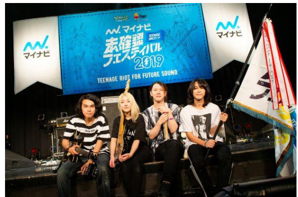
▲グランプリ受賞の SULLIVAN's FUN CLUB