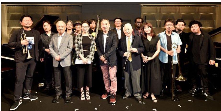
◀全員での集合写真

イベントでは、坂本美雨氏が MC をつとめ、音楽監督に村上春樹さんと親交の深い大西順子氏、ゲストに北村英治氏、渡辺貞夫クインテットなど豪華メンバーを迎えた一夜限りのスペシャルライブを実施。さらに、村上春樹ファンであり、兼ねてより親交のあるスガシカオによる「夜空ノムコウ」の弾き語り、高橋一生氏による村上春樹作品の朗読、村上春樹氏本人によるサプライズな朗読など、過去にない、プレミアムなイベントとなりました。イベントの終盤では、ノーベル生理学・医学賞を受賞した生物学者の山中伸弥氏も飛び入りでトークに参加。村上春樹作品のファンであることをエピソードとともに紹介しました。村上春樹氏初の公開収録イベントということもあり、大変大きな反響があり、ハガキと WEB を合わせて約 1 万 2000 通の応募がありましたが、限定 150 名のみの観覧だったため、2 週に渡る特別番組として当日の様様を広く届けました。