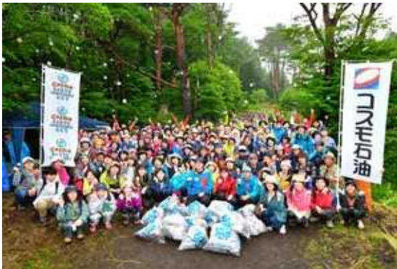
▲富士清掃登山参加者の集合写真