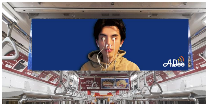
東京メトロ銀座線ギャラリートレインでの掲出イメージ ※掲出に関して、駅・係員へのお問い合わせはご遠慮ください。

グランプリ作品は、TOKYO FMが選出した協賛スポンサー賞(TOKYO FM)受賞作品「耳はどこへ行こう。」および他のデザイン部門入賞作品とともに、2021年5月1日～2021年5月15の期間に運行される東京メトロ銀座線一編成を貸切った「ギャラリートレイン」において掲出されます。